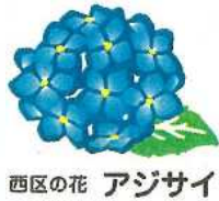
西区の花 アジサイ