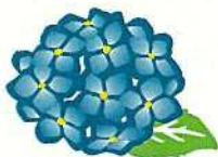
西区の花 アジサイ