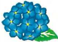
西区の花 アジサイ