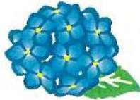
西区の花 アジサイ