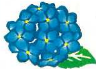
西区の花 アジサイ